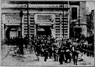
Mitte: Deutsche Truppen ziehen in der eroberten Metropole ein. Rechts: Die deutsche Besatzungsmacht in Maastricht nach dem ersten Anmarsch.