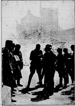
Links: Eine Besprechung nach der Einnahme von Maastricht.