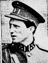
König Leopold von Belgien

Getrennt traf eine Sondermeldung von ungeheurer militärischer Bedeutung ein... (Text expressing gratitude to soldiers)