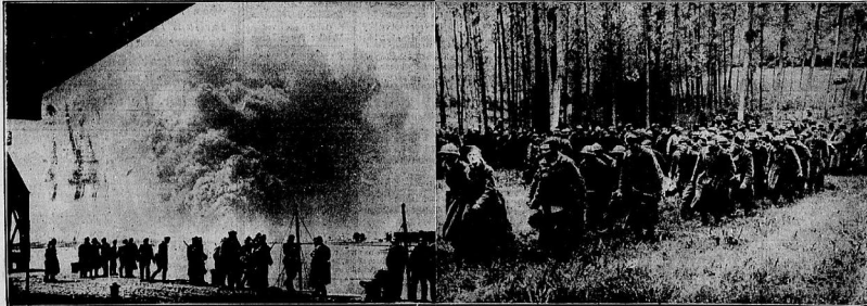
Links: Deutsche Soldaten an den Kanälen in der Nähe von Antwerpen kurz nach der Einnahme der Stadt. Vor ihrem Abzug haben die Engländer noch wichtige Anlagen zerstört und in Brand gesetzt. Rechts: Aus dem Sieges-Marsch im Ruhrgebiet wieder zurück. In diesen Kanälen werden gefangen Franzosen überführt.