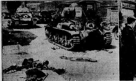
Englische und französische Panzerkompanien, die durch den deutschen Gegenstoß unerschützt geblieben waren, flüchten aus dem Gebiet von Hainaut auf den Westwall. — Einmarsch deutscher Truppen in Kopenhagen und Malmø. In diesen Gruppen standen die Volkstoten von Hainaut auf den Westwall.