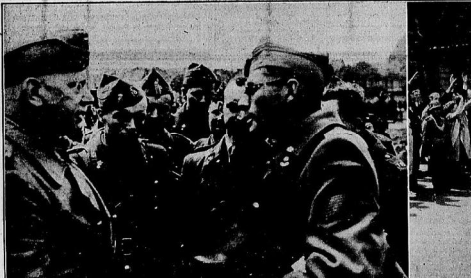
Generalstab von Heereskommando im Gespräch mit gelangenen belgischen Offizieren. — Einzug der deutschen Truppen in Amsterdam.