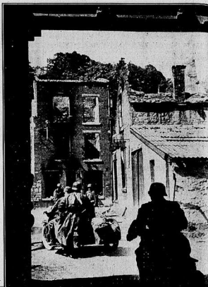
Aus dem hart umkämpften Bouillon.