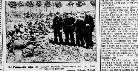
Die Philippinen haben ein erstes deutsches Panzerwagn mit vier Motor- und einem Fahrer gefangen.

In der Zange! Die deutsche Luftwaffe hat sich in der Nacht vom 24. auf den 25. Mai in der Nordsee mit einer Schwadron von vier bis fünf Maschinenflugzeugen in die Luft geschossen. Diese Schwadron wurde von einem Feindflugzeug angegriffen, das durch die deutschen Abwehrkräfte zerstört wurde.