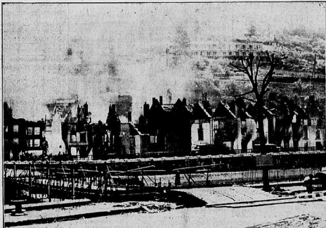
Zerschossene Häuser in Bouillon. Straßenziele in dem belagerten Bouillon hart an der französischen Grenze. Die Brücken wurden von Feind gepanzt, jedoch konnten unsere Panzer in verhältnißloser Zahl in unsere Zone der Durchdringung vordringen.