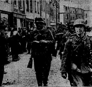
Abmarsch belgischer Truppen in Richtung Westen.