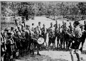
Trommel und Klänge

Die Jungen im Jellager. Sie sind hier in der ersten Woche ihres Lageraufenthaltes. Sie sind alle aus der Gegend um Barmen.