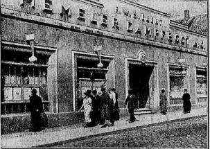
Das 'Memeler Dampfwerk', ursprüngl. Meise Vertriebs- und Industriehafen, weil es deutsche Industrie vertrat

Die Meise ist ein unglückliches Land, das von Gewalt überzogen ist. Die Meise ist ein unglückliches Land, das von Gewalt überzogen ist. Die Meise ist ein unglückliches Land, das von Gewalt überzogen ist. Die Meise ist ein unglückliches Land, das von Gewalt überzogen ist.