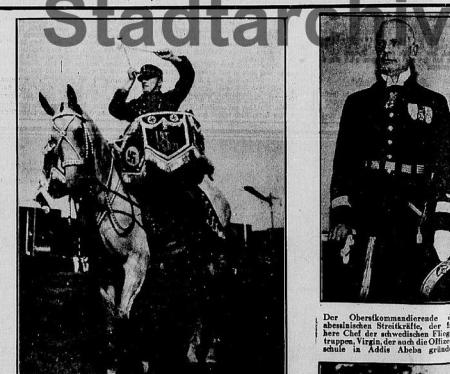
Der Pankauskoppel der SA-Reservestellung bei der Zellfäuna der Provinzial-Perforationsanstalt am Tag des Zerfalls in Köln-Deutz