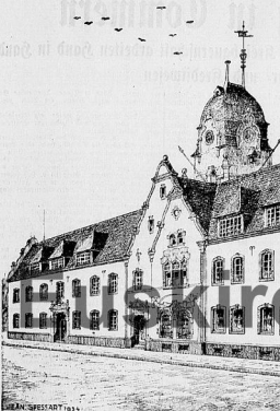
Das neue Rathaus in Euskirchen.