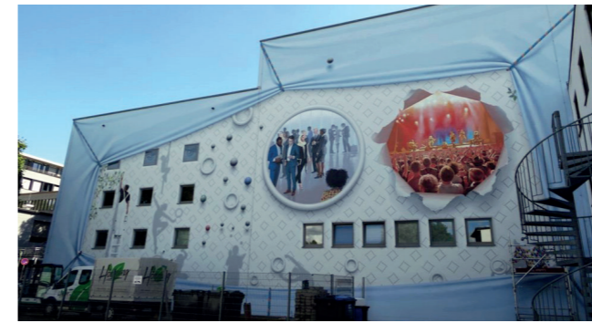
Stadt Bergheim, Kunst an einer Hausfassade