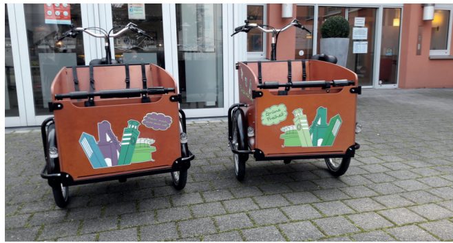
Stadt Sterkrade, Projekt Lastenrad-Verleih