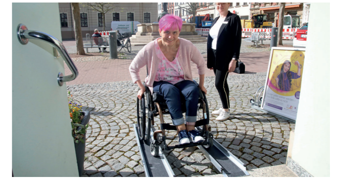
Stadt Crimmitschau, mobile Rampen