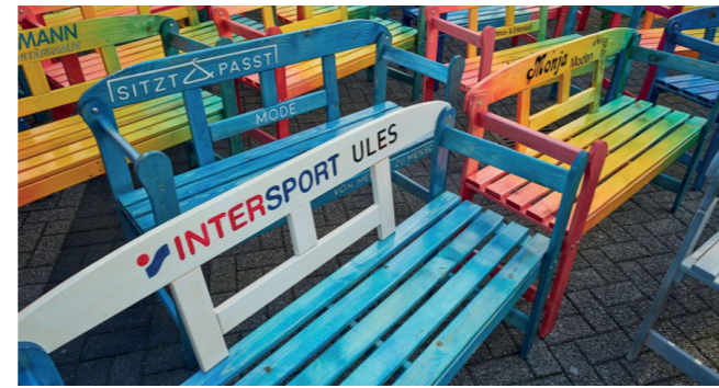
Stadt Herten, Projekt NEUSTART INNENSTADT