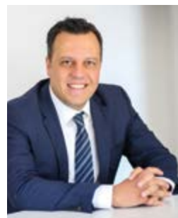
Sacha Reichelt Bürgermeister